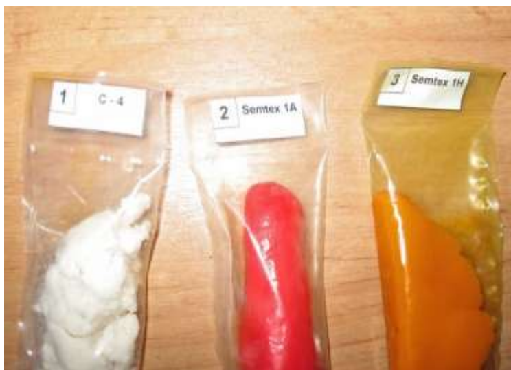
Vzorky plastické trhaviny C-4 a Semtex 1A / 1H

Trhaviny – jedná se například o tritol, amatol, hexogen, semtex, ostravit, danubit, pentrit, atd. Slouží jako náplň do dělostřelecké munice, granátů, nebo jsou použitelné k trhačím pracím. Bez iniciátorů, které je přivádějí k výbuchu, jsou poměrně bezpečné i při nárazu, zvýšené teplotě a dalších okolnostech, které při skladování či převozu mohou nastat. I tak je však třeba dbát zvýšené opatrnosti.