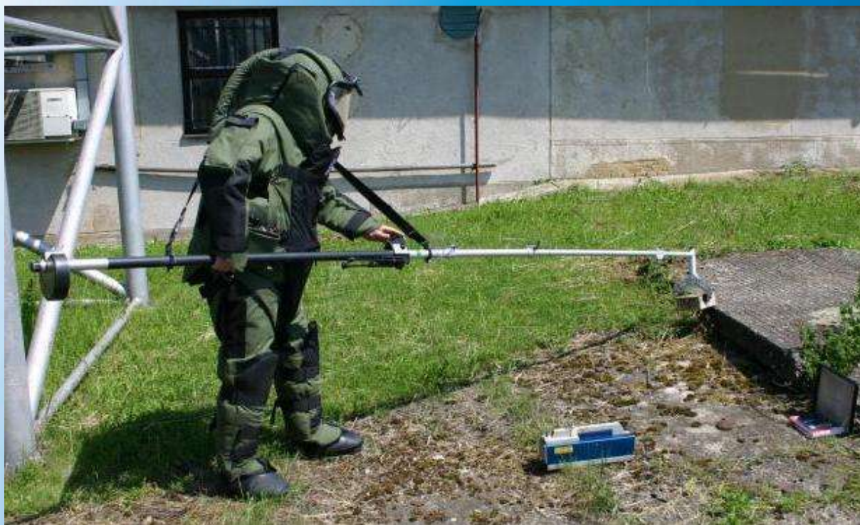
Pyrotechnik pracuje s podezřelým předmětem pomocí tyče odstupné manipulace

Vydalo preventivně informační oddělení krajského ředitelství policie hl.m. Prahy ve spolupráci s pyrotechniky a balistiky Policie České republiky v roce 2010 © Financováno z krajského programu prevence kriminality za přispění hlavního města Prahy.