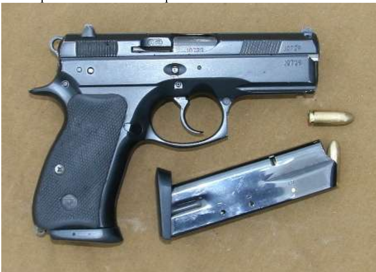
Česká pistole ČZ – 75 D Compact ráže 9x19 mm