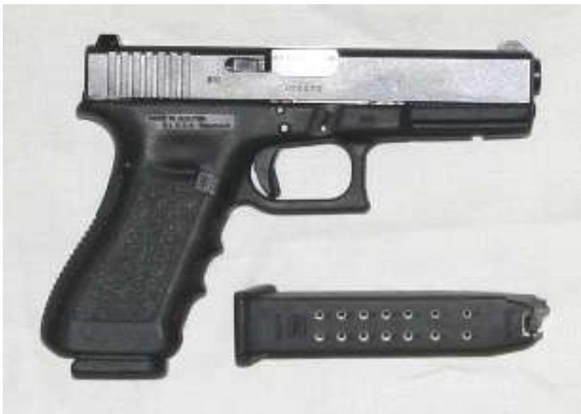
Rakouská pistole Glock 17 ráže 9x19 mm

Jedná se například o krátké zbraně, pistole a revolvery, určené pro osobní ochranu, nebo samonabíjecí pušky.