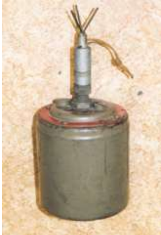
Československé protipěchotní šrapnelové a nášlapné miny