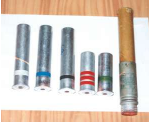
Náboje do signálních pistolí, vpravo raketový osvětlovací prostředek (ROS)