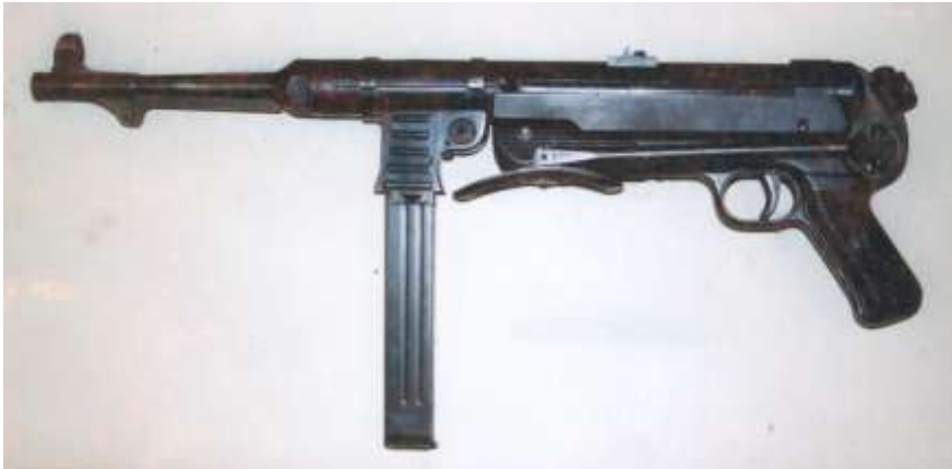
Německý samopal MP-40 ráže 9x19 mm z 2. světové války

A – Zakázané zbraně . Jde např. o samopaly, útočné pušky a kulometry střílející dávkou, vyhrazené až na výjimky pouze pro vojenské a policejní účely, nebo o nedovolenou výrobu a úpravy zbraní.