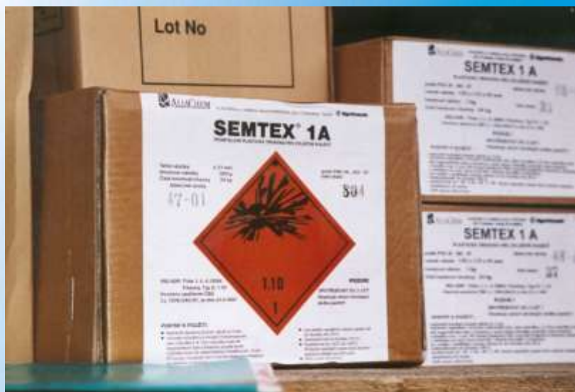
Plastická trhavina Semtex 1A v originálním balení od výrobce s označením pro výbušninu