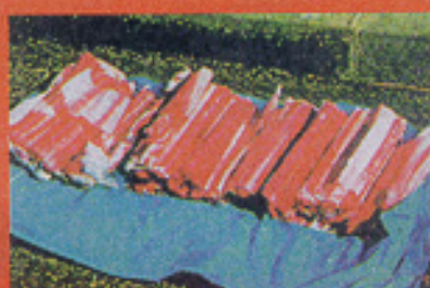
Plastická trhavina Semtex