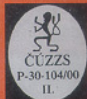
Znak státní zkušebny