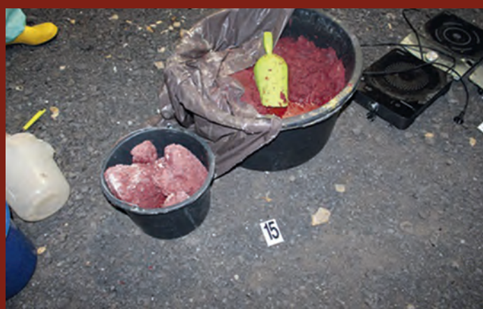
ČERVENÝ FOSFOR – AKTUÁLNÍ VÝVOJ VZHLEDEM K DOSTUPNOSTI A (NE)LEGÁLNÍMU VYUŽITÍ