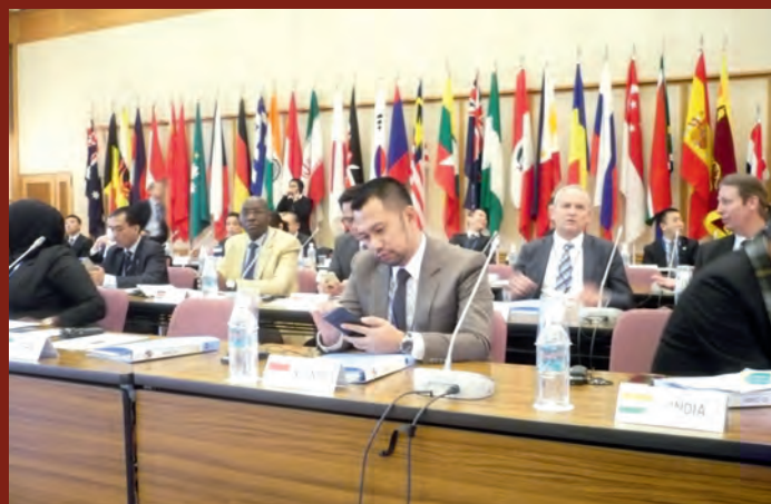
ASIJSKO-TICHOMOŘSKÁ POLICEJNÍ PROTIDROGOVÁ KONFERENCE V TOKIU