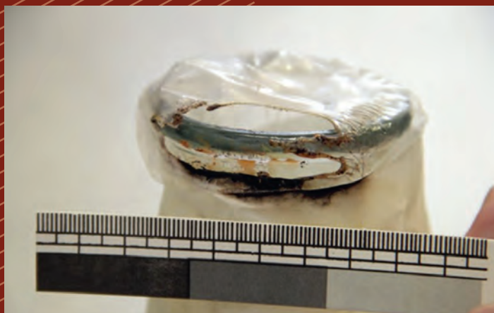
CHEMICKÁ REAKCE – SKRYTÁ HROZBA PŘI PŘEPRAVĚ ČI SKLADOVÁNÍ CHEMICKÝCH LÁTEK