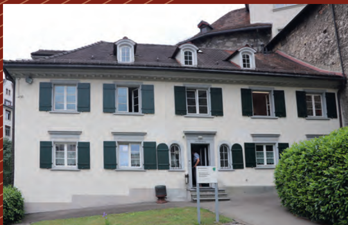
NÁVŠTĚVA ZÁSTUPCŮ KŘP LIBERECKÉHO KRAJE VE ŠVÝCARSKÉM ST. GALLEN